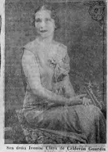
Sra. Srta. Ivonne Clays de Calderón Guardia

LA TRIBUNA engalana su sección social de hoy con la fotografía de la bella joven dama Srta. Ivonne Clays de Calderón Guardia, esposa del Excmo. señor doctor don Rafael Ángel Calderón Guardia, presidente de la república y quien hará los honores del gran baile que esta noche ofrecerá el Club Imperial Deportivo en los amplios salones del Club Unión en celebración de la tradicional Fiesta de la Independencia, y festival por el que se han hecho múltiples preparativos a fin de que resulte muy lucido como son nuestros mejores deseos.