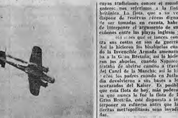
Sobre el famoso aeródromo civil de Croydon las balas de un Spitfire alcanzaron plenamente a este avión de bombardeo alemán que desciende, herido de muerte y con uno de sus motores en llamas, dejando una estela de humo negro que marca en el cielo grisáceo de Londres el camino en descenso del invasor herido.

Las más flexibles, suaves y durables. PIDALAS EN TODAS PARTES