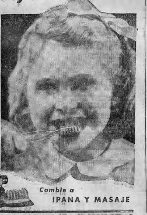
Cambie a IPANA Y MASAJE

Los niños de hoy en día saben, gracias a la instrucción de higiene bucal, que la dentadura rara vez luce y brilla y las sonrisas rara vez son atractivas y seductoras si las encías son blandas y tiernas. Tanto la maestra como el dentista de esta niña, probablemente le han dicho: "Las encías son muchas veces víctimas de nuestros modernos alimentos suaves que no les dan suficiente trabajo y ejercicio." Y añadirían, a menudo, que "conviene a las encías el saludable estímulo de Ipana y masaje."